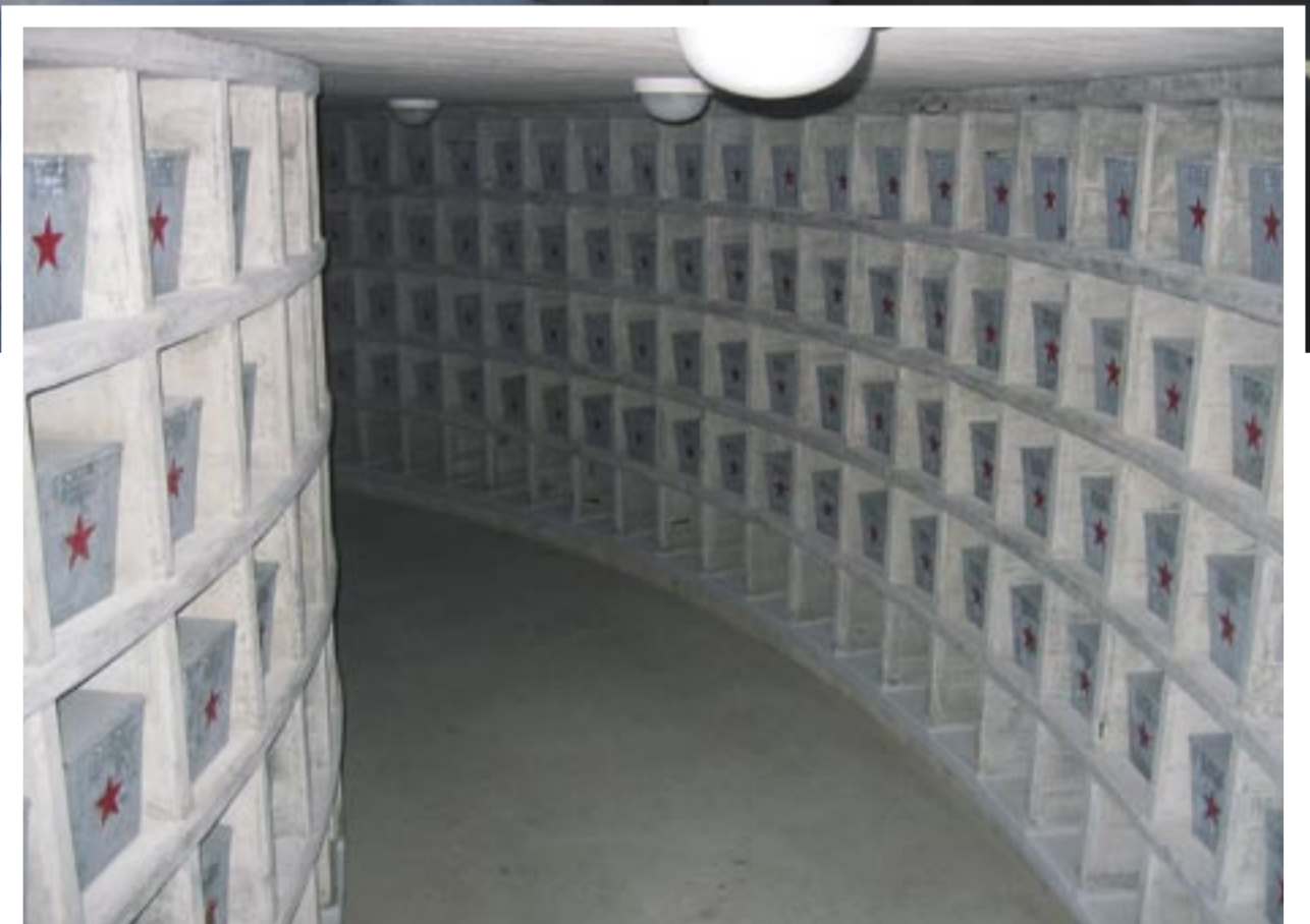
▲ Interno della cripta Interni de cripte Interior of the crypt Unutrašnjost spomen-kosturnice Notranjost kripte